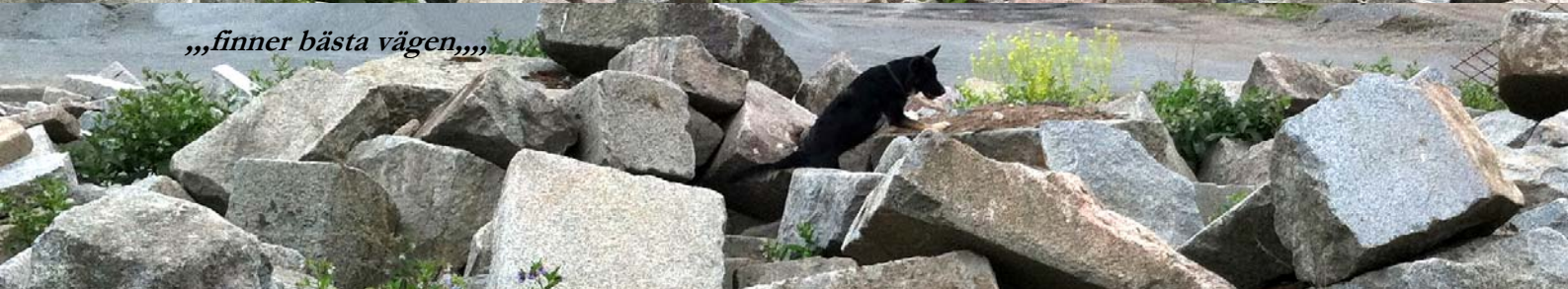
„,finner bästa vägen,,,