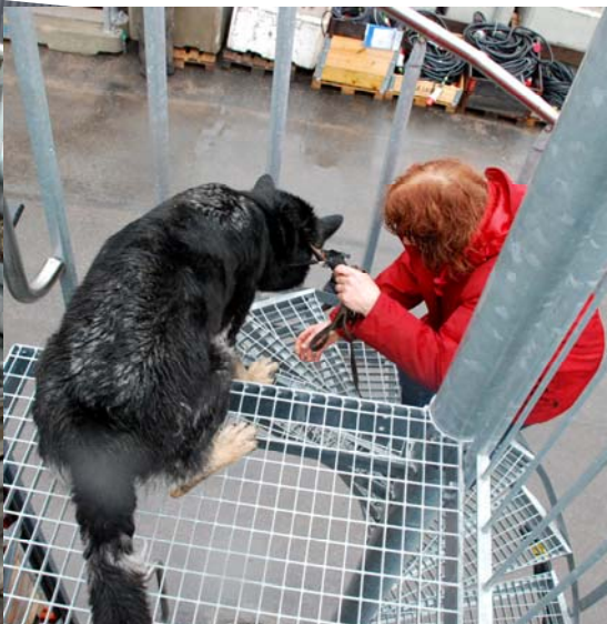
På toppen. Med självförtroendet i topp går det lätt. Uj, nu blev det svårt!