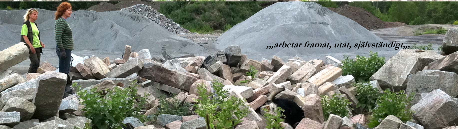
„,arbetar framåt, utåt, självständigt,,,