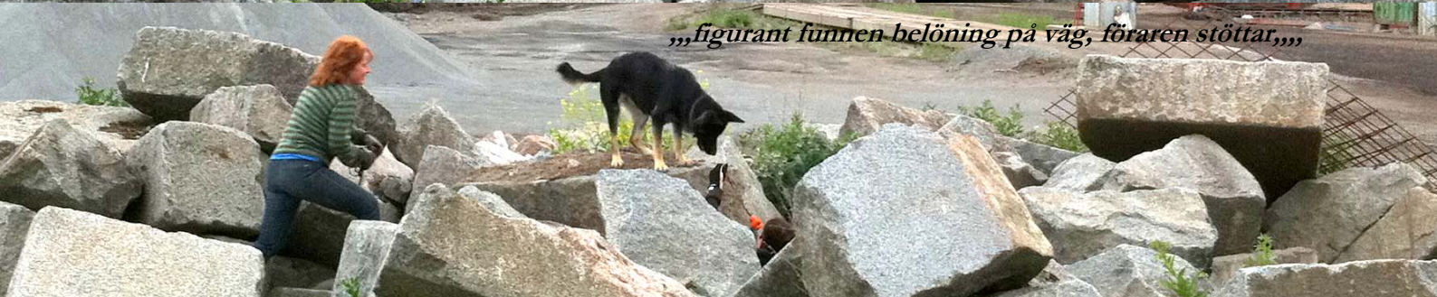
„,figurant funnen belöning på väg, föraren stöttar,,,