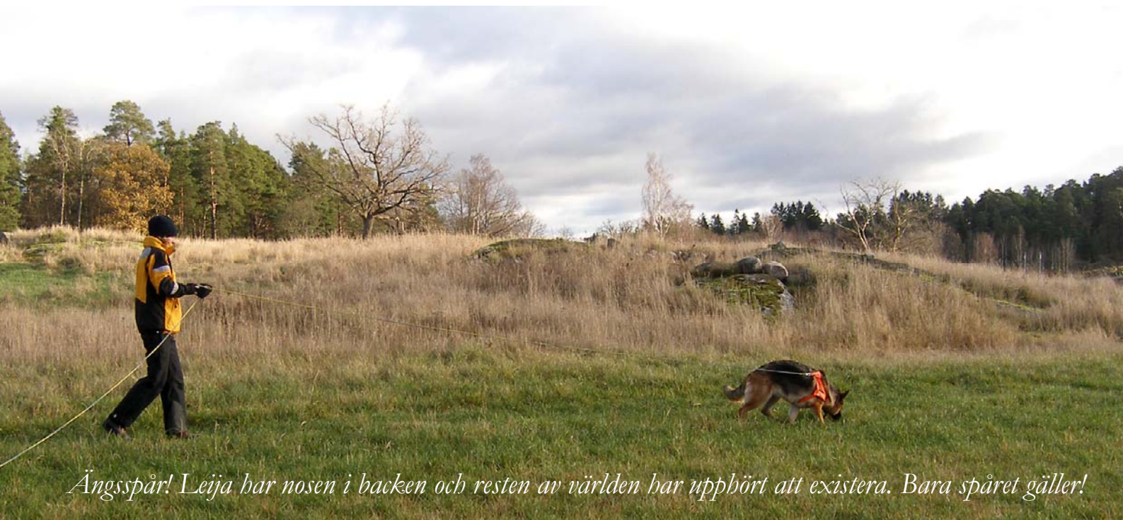
Ängsspår! Leija har nosen i backen och resten av världen har upphört att existera. Bara spåret gäller!