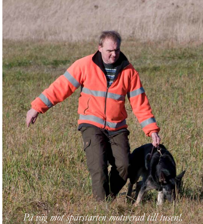
På väg mot spårstarten motiverad till tusen!

Nej! Men Du kan ge den rätt förutsättningar för att snabbt lära sig att förstå innebörden av ditt kommando "spår", och att då väntar någonting extra roligt och ett för hunden naturligt beteende/spårarbete. Nästan alla hundar älskar att spåra och lösa de problem som uppstår längs spårets väg. Min erfarenhet från de lydnadskurser jag har hållit är att de hundar och förare som kanske har haft det jobbigast att få till någon som helst form av lydnad, faktiskt ofta är de som lyckas bäst när vi varit ute i skogen och provat på spår. Jag tror att det beror på att spårarbetet är ett för hunden mycket självständigt arbete (därav den långa linan för att hunden ska få arbeta opåverkad av föraren) och för första gången under kursen får hunden tid att tänka och lösa uppgiften själv. Det kommer (förhoppningsvis!) inga svårtolkade kommandon från husse eller matte. Hunden får stoppa ned nosen och göra det den är skapt för utan störningar.