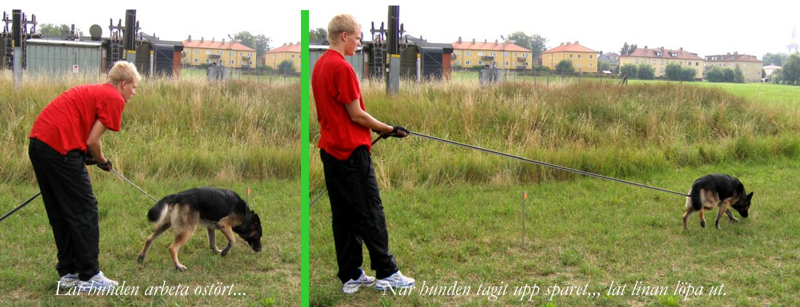
Låt hunden arbeta ostört...